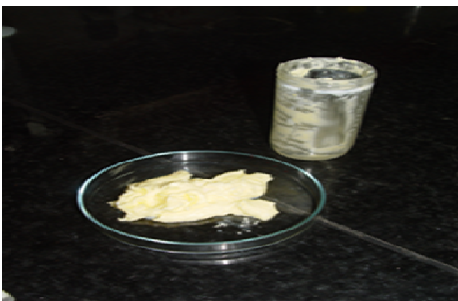
شکل ۵ نمایش سبترزیس قطرات فاز آبی پیش از ورز