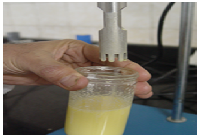
شکل ۳ هم‌وزنی‌سازی امولسیفیکاسیون