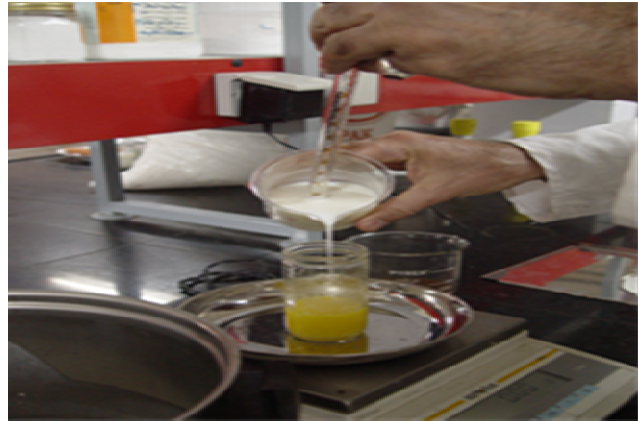
شکل ۱ افزودن شیر فرا پالایش به فاز چربی