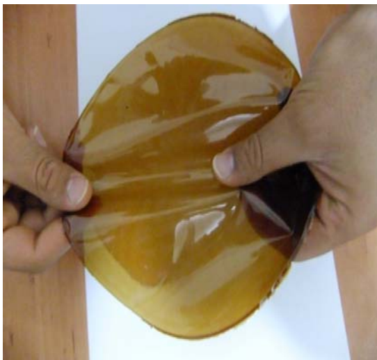
شکل ۲ نمونه‌ای از فیلم تهیه شده از پروتئین‌های دانه گاودانه

با توجه به اندیس‌های رنگ (=سیاه و =سفید) L، (سبز = a، قرمز = +a) و (آبی = -b، زرد = +b)، فیلم‌های حاصله با اندیس L، a و b ۳۲/۴۳، ۲۲/۴۱ و ۳۷/۲۰ (به ترتیب) قرمز تا قهوه‌ای روشن بودند. در مقایسه با سایر فیلم‌های پروتئینی مانند عدس، فیلم‌های گاودانه اندیس‌های L، a و b بیشتری داشتند و در مقایسه با فیلم سویا، اندیس L به مراتب کمتر و اندیس‌های a و b بیشتری را نشان دادند (۸،۹). مشخص شده که رنگ فیلم علاوه بر طبیعت ماده مورد استفاده، تحت تاثیر دما و pH نیز قرار می‌گیرد. هر چه دما و pH بالاتر باشد فیلم‌های حاصله تیره‌تر خواهند بود زیرا حلال‌های قلیایی نسبت به سایر حلال‌ها، رنگدانه‌ها را بیشتر استخراج می‌کنند (۸). طبیعی است هر چه دما بالاتر باشد، سرعت و شدت استخراج رنگدانه‌ها نیز بیشتر خواهد بود. البته باید توجه داشت که رنگ فیلم عامل مهمی در کاربرد آن به شمار می‌آید. رنگ نسبتا تیره فیلم حاصل از گاودانه نشان می‌دهد که این فیلم برای بسته‌بندی موادی که نسبت به نور حساس هستند مناسب می‌باشد. در شکل ۲ نمونه‌ای از فیلم تهیه شده از پروتئین دانه گاودانه قابل مشاهده است.