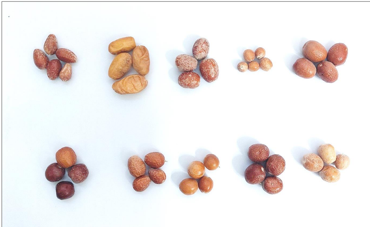
Fig. 1: Some populations of Elaeagnus angustifolia L. in this study (above, left to right: Naein 2, Shahrekord, Habib-abad 1, Meimeh, Habib-abad 2; below left to right: Semirom, Naein 1, Koochpayeh, Farokh-shahr, Zarrin-shahr)

بختیاری، اجرا شد. جمع‌آوری میوه‌های سنجد (شکل ۱)، در مرحله رسیدگی کامل میوه، در مهر و آبان‌ماه سال ۱۳۹۹ از نقاط مختلف دو استان مذکور (طبق اطلاعات مندرج در جدول ۱) که از رویشگاه‌های این گیاه می‌باشد، صورت گرفت و آزمایش‌ها در آزمایشگاه گروه علوم