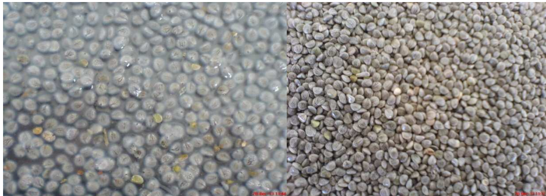
شکل ۱ در سمت چپ دانه های مرو و در سمت راست دانه مرو متورم شده نشان داده شده است.

فرمول چهار تخمه استفاده سنتی دارد [۱۶، ۱۷، ۲۴ و ۲۶].