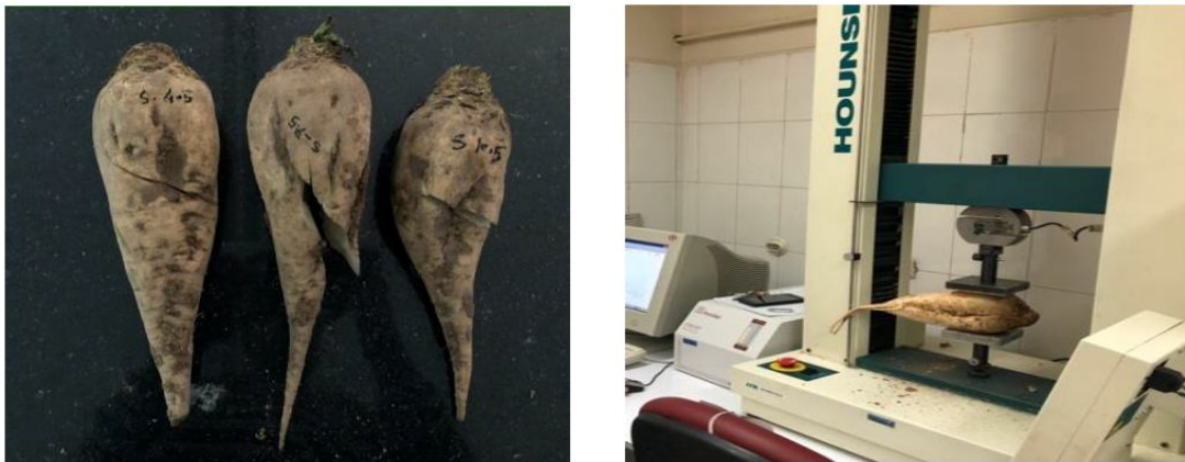
Fig 1 Pressure test of sugar beet samples