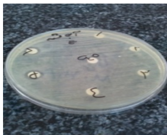
شکل ۴ قطر هاله مهار رشد عصاره آبی مشهد بر روی اشرشیاکلی