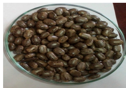
شکل ۲ دانه کرچک واریته مشهد