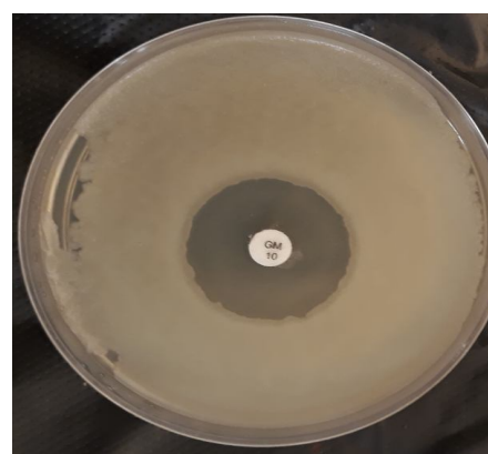
Fig 1 The interaction of orange essential oil(OEO)with gentamicin antibiotic on Bacillus cereus .

نتایج مربوط به فعالیت ضد میکروبی اسانس پوست پرتقال به روش حفره در آگار، حداقل غلظت بازدارندگی از رشد و حداقل غلظت کشندگی بر سویه‌های مورد بررسی در جدول ۲، آورده شده است. در آزمون حفره در آگار بیشترین هاله عدم رشد مربوط به باکتری گرم مثبت استافیلوکوکوس اورئوس با قطر ۱۷/۳۰ میلی-متر بود. کمترین هاله عدم رشد مربوط به باکتری گرم منفی اشرشیاکلی با قطر ۱۱/۱۰ میلی‌متر بود. نتایج مربوط به حداقل غلظت بازدارندگی از رشد باکتری‌های اشرشیاکلی، سودوموناس آئروژینوزا، سالمونلا تیفی، استافیلوکوکوس اورئوس، باسیلوس سرئوس، باسیلوس سابئیس، استافیلوکوکوس اپیدرمیدیس و