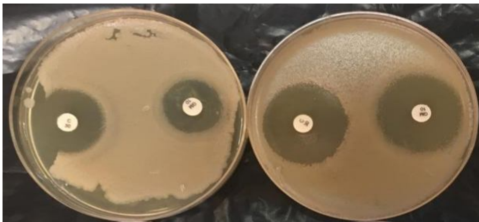
Fig 1 The interaction of Menthapulegium essential oil with Chloramphenicol antibiotic on Escherichia coli .

➤ MPEO: Menthapulegium essential oil, Gen: Gentamicin, Chl: Chloramphenicol, In: Interaction, Syn: Synergy, Ant: Antagonism, Ind: Indifferent.