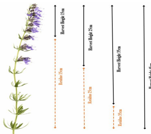
Fig 1 Different height treatments and residual stalk at each harvesting level

این پژوهش در قالب طرح بلوک‌های کامل تصادفی در ۳ تکرار در بهار سال ۱۳۹۷ انجام شد. زمان برداشت ۶۰ روز پس از کشت گیاه بود و تیمارهای آزمایش شامل ۴ ارتفاع برداشت ۱۵، ۲۵، ۳۵ و ۴۵ سانتی‌متر از بالاترین قسمت گیاه و همچنین ۳ تیمار مربوط به ساقه اندام باقی‌مانده (R) ارتفاع‌های ۱۵، ۲۵ و ۳۵ سانتی‌متری بودند (شکل ۱). ابعاد هر کرت ۶×۳ متر مربع بود. بذره‌های گیاه از شرکت پاکان بذر اصفهان، ایران خریداری و به دقت در زمین آماده شده کاشته شدند. کنترل علف‌های هرز به روش مکانیکی انجام شد.