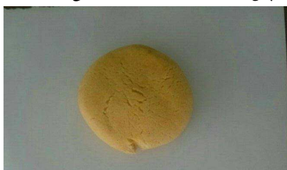
Fig 1 Appearance of cake without coating (control) after 10 days storage at ambient temperature

مقایسه شرایط بهینه با نمونه بدون پوشش در طول مدت نگهداری نشان می‌دهد، میزان بتاکاروتن در کیک‌ها بعد از سه روز کاهش معنی‌داری در نمونه‌های پوشش‌دار و بدون پوشش ندارد. اما در روز دهم کاهش میزان بتاکاروتن در هر دو نمونه شاهد و نمونه پوشش‌دار شده مشاهده می‌گردد. از آنجاکه بتاکاروتن یک ترکیب حساس به اکسیژن و نور است، کاهش ایجاد شده می‌تواند به دلیل تجزیه بتاکاروتن تحت تاثیر نور و هوای محیط باشد (جدول ۱۲). نکته قابل توجه این است که میزان کاهش در نمونه‌های پوشش‌دار شده به مراتب کمتر از نمونه‌های شاهد است که به خوبی تاثیر پوشش بر روی حفظ بتاکاروتن کیک‌ها را نشان می‌دهد. در واقع وقتی زمان نگهداری کیک‌ها طولانی می‌شود بتاکاروتن در قسمت‌های بیرونی‌تر بیشتر در معرض هوا و نور قرار داشته و در نتیجه بیشتر تجزیه می‌شوند در حالیکه بتاکاروتن در قسمت‌های درونی‌تر کیک از معرض نور و هوای محیط دور می‌ماند. در این حالت پوشش بیوپلیمری می‌تواند از تجزیه بتاکاروتن در سطح کیک‌ها جلوگیری کند. این موضوع به صورت چشمی و در ظاهر کیک‌ها پس از ده روز به خوبی قابل مشاهده بود. شکل ۱ نمونه شاهد بدون پوشش بیوپلیمری و شکل ۲ نمونه پوشش‌دار را پس از ده روز نگهداری نشان می‌دهد.