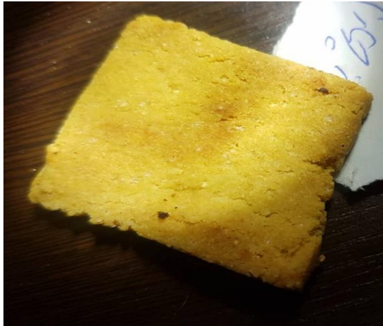
Fig 2 Quinoa and corn flour cracker biscuit sample