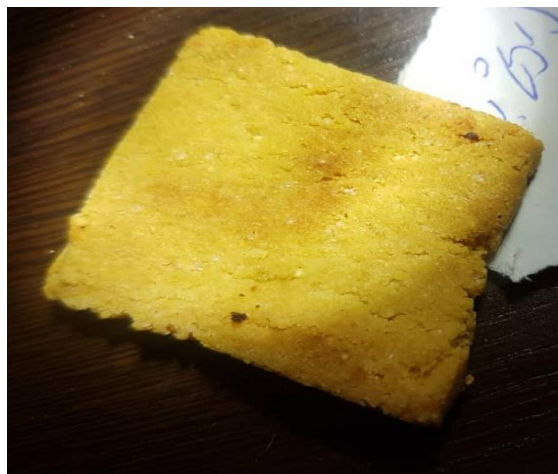
Fig 2 Quinoa and corn flour cracker biscuit sample