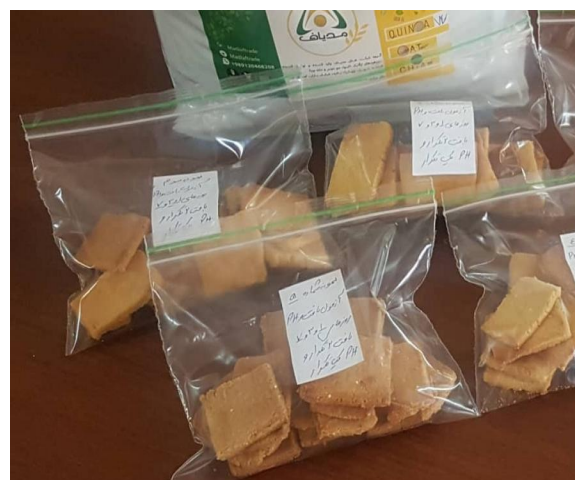
Fig 1 Quinoa and corn flour cracker biscuit in HPPE packages