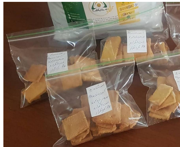
Fig 1 Quinoa and corn flour cracker biscuit in HPPE packages