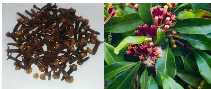
Fig 1 (a) Eugenia caryophyllata Tree. (b) Eugenia caryophyllata Bud

آب - بخار اسانس گیری شد و اثر روش های مختلف در بازدهی میزان اسانس مشخص گردید، سپس اسانس بدست آمده توسط هر یک از روش های اسانس گیری با GC/MS آنالیز شد و ترکیبات اجزاء اسانس میخک تعیین و سپس کمیت و کیفیت این ترکیبات با یکدیگر مقایسه شدند. همچنین اثر ضد باکتریایی هر سه اسانس بر سه باکتری گرم مثبت (استافیلوکوک اورئوس، استافیلوکوک اپیدرمیدیس، استرپتوکوک موتانس) و سه باکتری گرم منفی (سودوموناس آئروژینوزا، اشریشیاکلی و سالمونلا تایفی موریوم) مورد بررسی قرار گرفت و با نتایج مطالعه آنتی بیوگرام دوازده آنتی بیوتیک متداول بررسی و مقایسه شد.