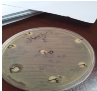
شکل 5 قطر هاله مهار رشد عصاره آبی اصفهان بر روی اشرشیاکلی

چاهک شماره 10 برداشته و به چاهک شماره (12) که شاهد و کنترل منفی است اضافه گردید. در مرحله بعد به تمام چاهک ها به غیر از چاهک شماره 12 (کنترل منفی) 5 میکرولیتر از سوسپانسیون باکتریایی (با غلظت 1 \times 10^8 cfu/ml) اضافه شد. پس از آن میکروپلیت در انکوباتور با دمای 37 درجه سانتی گراد به مدت یک شبانه روز قرار گرفته و سپس کدورت آن توسط دستگاه الیزا ریدر ELX808 در طول موج 620 نانومتر اندازه گیری شد. به منظور انجام تکرار در آزمون به طور مشابهی یک نمونه میکروپلیت 96 خانه ای دیگر آماده شده و بعد از تلقیح سوسپانسیون میکروبی درون انکوباتور با دمای 37 درجه سانتی گراد به مدت 24 ساعت قرار گرفت. به منظور آماده سازی نمونه شاهد (به منظور حذف میزان جذب سایر ترکیبات بجز تعداد ریزسازواره ها و همچنین محاسبه محدوده MIC) روش ذکر شده بالا بجز افزودن ریزسازواره ها بطور دقیق در دو تکرار انجام شد. برای تعیین MIC به آن 50 میکرولیتر معرف TTC 1 با غلظت 5mg/ml در هر چاهک اضافه و سپس به مدت 3 ساعت دوباره درون انکوباتور 37 درجه سانتی گراد گرم خانه گذاری شد. یک غلظت بالاتر از آخرین غلظتی که رنگ قرمز تترازولوم به خود گرفته بود به عنوان MIC عصاره در نظر گرفته شد [11].