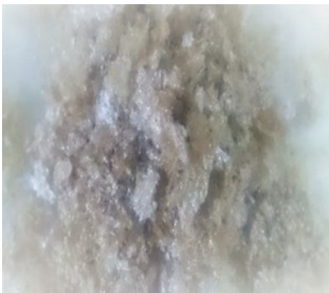
Fig 2 Gum made from Lallelantia royleana seed

دانه‌ی بالنگو از تهران خریداری و آلودگی‌های ثانویه‌ی آن‌ها حذف شد. ابتدا دانه‌های بالنگو به مدت ۲۰ دقیقه درون آب مقطر با دمای 25^{\circ}\text{C} در pH برابر ۷ و نسبت آب به دانه برابر ۲۰ به ۱ قرار گرفت [۱۸]. مدت زمان ۲۰ دقیقه توسط اکستراکتور خانگی (آب‌میوه‌گیری) با مدل (MJ – japan, Panasonic, J176P) استخراج [۷] و محلول صمغ از صافی‌های توری با قطر منافذ 20\ \mu\text{m} عبور داده شد [۱۹] و موسیلاژ بدست آمده در آون ( 105^{\circ}\text{C} و ۴ ساعت) خشک گردیده شد و بوسیله آسیاب (SUNNY, SFP-820, China) به پودر تبدیل شد [۷].