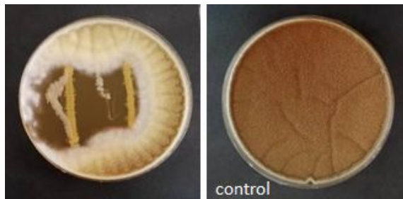
Fig 3 Antifungal effect of the LAB isolate on A. niger after 4 incubation day, in comparison with the control plate in overlay bioassay.

درصد رشد قارچ را کاهش داده و از اسپورزایی (ایجاد رنگ سیاه) آن نیز ممانعت نماید.