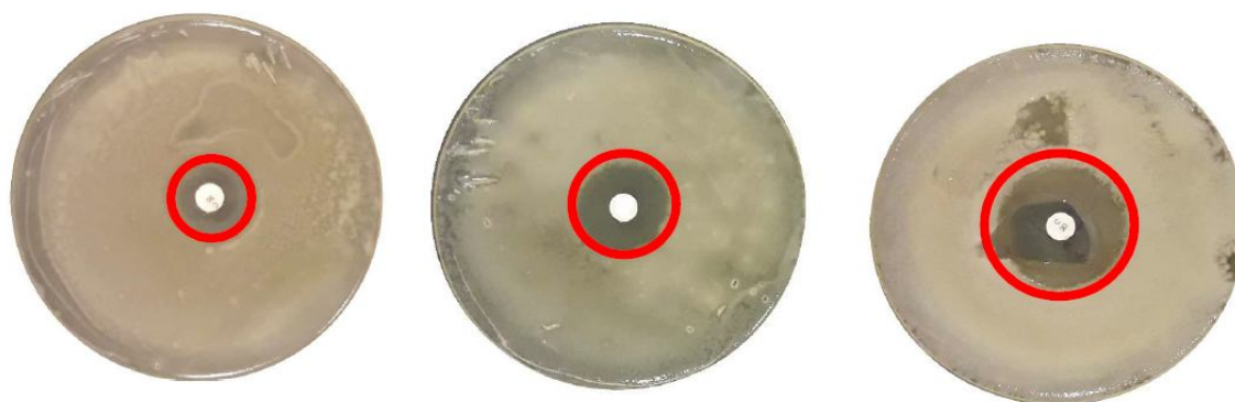
A: The effect of Chl on E. coli

- Ocimumbasilicum essential oil: OBEO, Tet: Tetracycline, Chl: Chloramphenicol, In: Interaction, Syn: Synergy, Ind: Indifference, Ant: Antagonism.