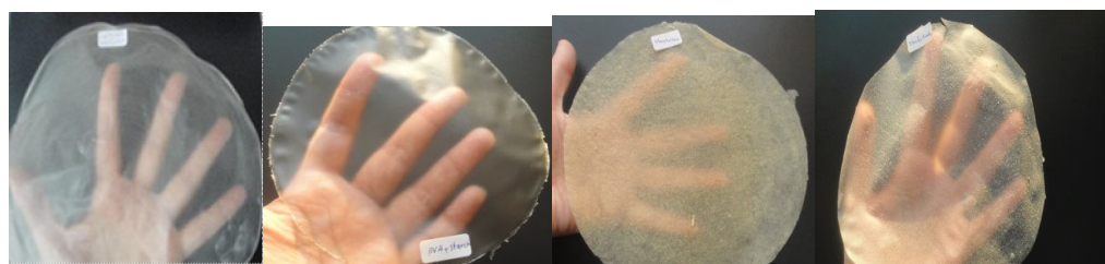
Fig 2 Composite films of starch-Olibanum, starch-Zein, starch-PVA and control (starch), from right to left respectively.