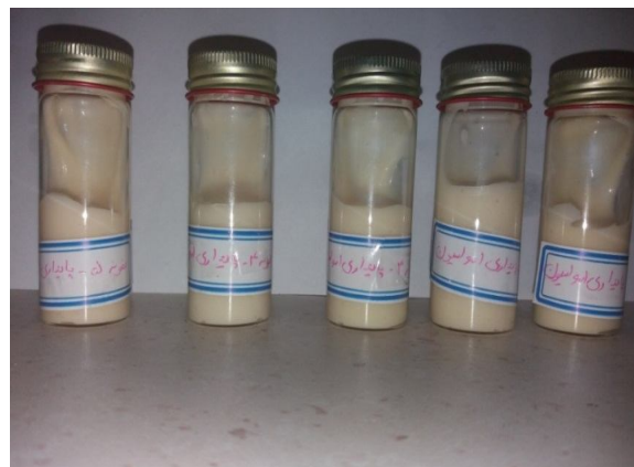
Fig 2 Appearance and stability of Mayonnaise sauce emulsion at 30 th day of storage.

امولسیون پایدار، به امولسیون اطلاق می شود که هم آمیختگی، رونیینی و خامه ای شدن در آن رخ ندهد پدیده خامه ای شدن در نمونه های سس مایونز پرچرب که حاوی مقادیر بالای روغن هستند کم تر اتفاق می افتد، به این دلیل که قطرات روغن به شدت با یکدیگر تماس داشته و اصطکاک حاصل بین آن ها مانع از خامه ای شدن می گردد. در طول دوره نگهداری هیچ گونه روغن زدگی در سطح هیچکدام از نمونه های سس مشاهده نشد (شکل ۲) که نشان دهنده ی پایداری مطلوب نمونه های تهیه شده می باشد.