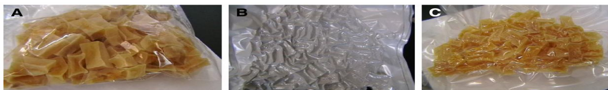
Fig 2 (A) Transpirant biaxially oriented polypropylene (BOPP) laminated; (B) polyethylene-polyamide laminate; (C) semi-transparent BOPP

بسته بندی علاوه بر ایجاد جذابیت برای مصرف کننده باعث حفاظت و جلوگیری از تخریب محصول می‌شود [۱۰]. بسته‌بندی نقش اصلی را در حفظ محصول در برابر صدمات و آسیب‌های خارجی دارد و باعث حفاظت آن در برابر اکسیژن، بخار آب، نور و افزایش ماندگاری می‌شود و علاوه بر آن خصوصیات حسی و ثابت رنگ را بهبود می‌بخشد و از خشک شدن بیش از حد ماده غذایی جلوگیری می‌کند. تخریب مواد غذایی در طول ذخیره سازی با انتخاب مناسب مواد بسته‌بندی و شرایط بسته بندی تا حد زیادی کاهش می‌یابد. فیلم‌هایی که برای بسته‌بندی انتخاب می‌شوند باید ویژگی‌های نفوذپذیری خاصی داشته باشند [۸ و ۲۶]. تعیین خواص ممانعت کنندگی پلیمرها در تعیین مدت ماندگاری محصول بسته بندی شده بسیار مهم است. بررسی رطوبت در سبب زمینی‌های خشک شده با میکروویو کاهش رطوبت معنی داری را در نمونه‌های بسته بندی شده در BOPP شفاف و BOPP صدفی نسبت به پلی اتیلن پلی آمید نشان داد. جدول ۵ نشان می‌دهد که مکعب‌های سبب زمینی خشک شده با میکروویو که در پلی اتیلن پلی آمید بسته‌بندی شده‌اند حداقل کاهش رطوبت و نفوذ پذیری را داشته‌اند. مشابه این مشاهدات در مورد افزایش رطوبت در طول بسته‌بندی در زردآلوی خشک شده با خورشید توسط Alagoz گزارش شد [۲۷] که این نتایج می‌توانند به علت نفوذ ناپذیرتر بودن پلی اتیلن نسبت به