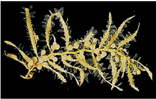
شکل ۱ جلبک Sargassum sp

ویبریو و غیره همزیست بوده که بعضا وجود آنها در لوله گوارش جانوران می‌تواند اثرات مثبتی به همراه داشته باشد.