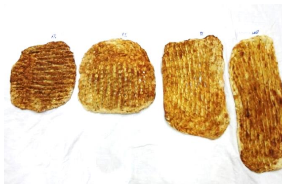
Fig 1 Samples of cooked bread in order from right to left: control sample, sample 2%, 4% of samples, sample 8%

آرد ستاره (آرد مخصوص نان بربری) با درجه استخراج ۷۸٪ و ویژگی های شیمیایی اندازه گیری شده از جمله خاکستر ۰/۵۵۹، رطوبت ۱/۴۱، اسیدیته ۲/۱، pH ۶/۱، گلو تن ۳۰ و زلنی ۲۱ از کارخانه آرد جنوب تهیه گردید. درصدهای مختلف تفاله پرتقال (۲، ۴، ۸ درصد وزنی آرد)، به همراه سایر مواد اولیه جهت پخت نان بربری (آرد، نمک و مخمر خشک به ترتیب ۲ و ۱ درصد وزنی آرد، آب (تعیین شده توسط دستگاه فارینوگراف)، داخل خمیرکن (همانند شرایط مربوط به نان شاهد) مخلوط شدند، پس از گذراندن مرحله تخمیر درون کابینت به مدت ۴۵ دقیقه، در رطوبت نسبی ۸۵ درصد و دمای ۳۵ °C به چانه های ۶۰۰ گرمی تقسیم گردید. پس از استراحت مجدد، درون فر عملیات پخت نان انجام شد. پس از خروج از فر و سرد شدن در دمای اتاق نان ها را در کیسه های پلی اتیلنی زیپ-کیپ بسته بندی و جهت آزمون ها نگهداری شد. نمونه های پخته شده نان بربری در شکل ۱ نشان داده شده است.