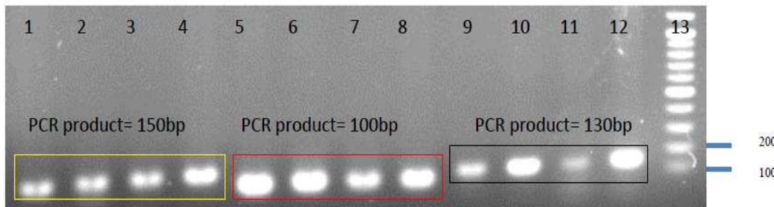
Fig 2 Gel electrophoresis of PCR product of DNA extracted

1- Aspergillus 2- Aspergillus 10 1 3- Aspergillus 10 3 4- Aspergillus 10 5 5- Rhizopus 6- Rhizopus 10 1 7- Rhizopus 10 3 8- Rhizopus 10 5 9- penicillium 10- Penicillium 10 1 11- Penicillium 10 3 12- Penicillium 10 5 13- ladder