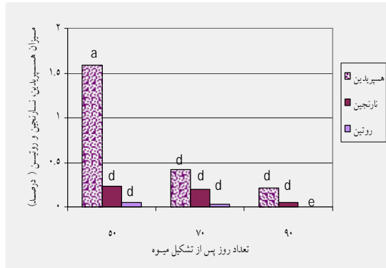
شکل ۲ تغییرات میزان فلاونوئیدها در گوشت میوه در مراحل مختلف برداشت

درصد وزن خشک) و کمترین میزان آن، مربوط به ۹۰ روز پس از تشکیل میوه (۰/۰۲۶ درصد وزن خشک) بود.