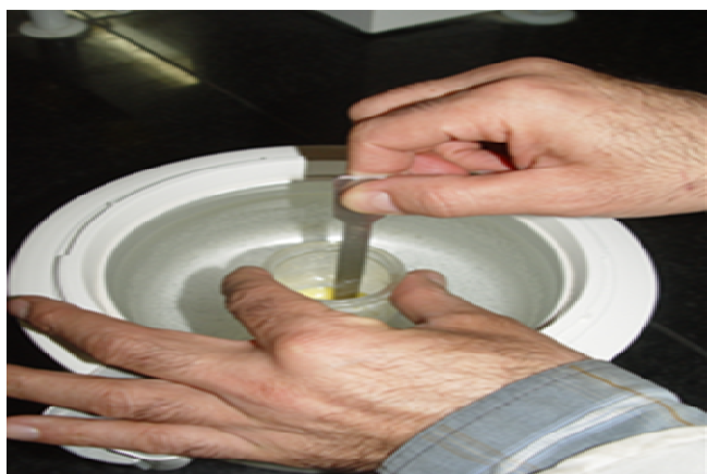
شکل ۴ جامدسازی امولسیون