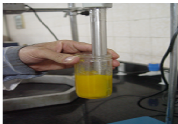
شکل ۲ هم زدن و اختلاط دو فاز