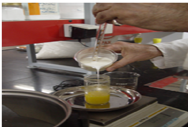
شکل ۱ افزودن شیر فرآپالایش به فاز چربی