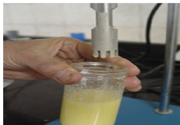
شکل ۳ هم‌وزنی‌اسیون (امولسیفیکاسیون)