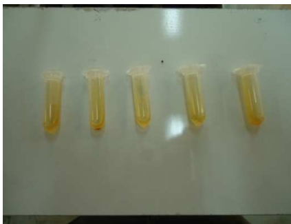
شکل ۱ آزمون حساسیت رقت‌های مایع