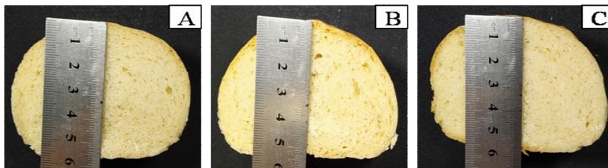
Fig 1 Height of breads (A sourdough bread containing B. coagulans (fermentation temperature and time 30°C and 12 h, respectively), B sourdough bread containing B. coagulans and fructooligosaccharide (fermentation temperature and time 30°C and 12 h, respectively) and C Control bread)

شاخص ارتفاع قله نان، با حجم نان رابطه مستقیم داشته و در