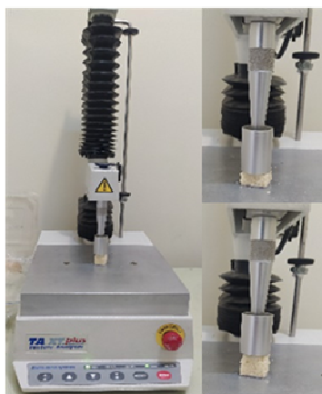
Fig 3 Texture analyzer

ارزیابی بافت از جمله ویژگی‌های مهم و اصلی برای پیش‌بینی کیفیت و پذیرش نهایی محصول است [۱۷]. شاخص سفتی بافت بیانگر مقاومت بافت محصول در برابر نیروی اعمال‌شده بدون تخریب اساسی آن می‌باشد [۲].