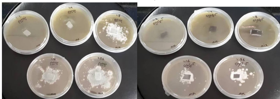
Fig 1 MFC of Aspergillus niger (top) and Penicillium expansum (bottom)

و غلظت ۵ میلی گرم بر میلی لیتر بود. کمینه غلظت مهارتی نسبت به باکتری استافیلوکوکوساورئوس با رقت ۱:۳۲ و غلظت ۰/۳۱۲ میلی گرم بر میلی لیتر و کمینه غلظت کشندگی نسبت به باکتری استافیلوکوکوساورئوس، با رقت ۱:۱۶ و غلظت ۰/۶۲۵ میلی گرم بر میلی لیتر به دست آمد. کمینه غلظت مهارتی نسبت به باکتری لیستریامونوسیتوژنز با رقت ۱:۸ و با غلظت ۱/۲۵ میلی گرم بر میلی لیتر و کمینه غلظت کشندگی نسبت به باکتری لیستریامونوسیتوژنز با رقت ۱:۴ و غلظت ۲/۵ گرم بر میلی لیتر بود. مقدار کمینه غلظت مهارتی و کمینه غلظت باکتری کشی در باکتری سالمونلاتیفیموریوم به ترتیب ۲/۵ و ۵ میلی گرم بر میلی لیتر تعیین گردید. در تایید نتایج بدست آمده، ویراکودا و همکاران (۲۰۱۰) در تلاش برای یافتن ترکیبهایگزین نگهدارنده مصنوعی در مواد غذایی، مخلوط هایی از عصاره های اکالیپتوس، رزماری و خلنجان مصری را تولید و خواص ضد میکروبی آنها را بر باکتری های آلوده کننده مواد غذایی بررسی نمودند. طبق نتایج بدست آمده ترکیب خلنجان مصری و رزماری دارای خواص ضد میکروبی بر باکتری های استافیلوکوکوساورئوس و لیستریامونوسیتوژنز بود و ترکیب خلنجان و اکالیپتوس اثر ضد میکروبی خوبی بر اشریشیاکلی و سالمونلاتیفیموریوم از خود نشان داد [۲۵]. در پژوهش لی و همکاران (۲۰۱۹) جهت ارزیابی فعالیت ضد میکروبی ترکیب عصاره های الکلی سه گیاه اکالیپتوس گلوبولوس، یوکا ریکورویفولیا و درخت چای بر روی انواع مخمر و باکتری های موجود بر روی پوست انسان مشخص گردید ترکیب عصاره های الکلی این سه گیاه با مقدار MIC ۰/۲۴ میلی گرم بر میلی لیتر دارای خاصیت ضد میکروبی بود و از آنتی بیوتیک های آمپی سیلین و تریکلوسان بسیار قوی تر عمل نمود [۲۶]. تحقیقات نشان داده که مهم