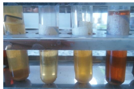
Fig 3 Different vinegars: in order from right to left: jujube vinegar, traditional apple vinegar, commercial apple vinegar, traditional grape vinegar

گردید که نمونه سرکه عناب بیشترین امتیاز طعم (۴/۴۰) را به خود اختصاص داد که با سایر نمونه‌ها اختلاف معنی‌داری داشت ( p \leq 0.05 ). کمترین مجموع امتیاز ارزیابی حسی طعم (۱/۷) متعلق به نمونه سرکه سیب تجاری بود که با سایر نمونه‌ها اختلاف معنی‌داری نشان داد. همچنین بررسی نتایج رنگ نشان داد بالاترین امتیاز رنگ مربوط به سرکه عناب و کمترین امتیاز رنگ مربوط به سرکه انگور بود. کمترین امتیاز آروما و پذیرش کلی در نمونه سرکه انگور بود که تفاوت معنی‌داری با سایر نمونه‌ها در سطح ۵ درصد داشت. بیشترین امتیاز پذیرش کلی و آروما نیز در نمونه سرکه عناب بود که با سایر نمونه‌ها اختلاف معنی‌داری نشان داد ( p \leq 0.05 ).