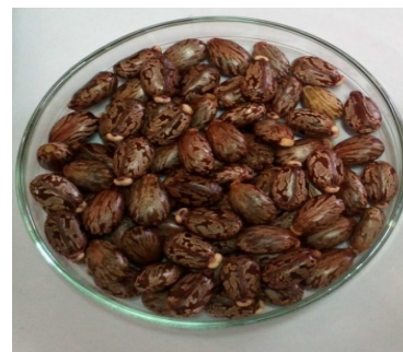
شکل ۱ دانه کرچک وارسته اصفهان

عصاره گیری به روش خیساندن انجام شد. ابتدا ۵۰ گرم دانه کرچک در آسیاب خرد و سپس با آب مقطر استریل به حجم ۲۰۰ میلی لیتر رسیده و طی ۷۲ ساعت در دمای محیط تکان داده شد. در ادامه با کاغذ صافی استریل، عصاره ها صاف و عصاره های حاصل به طور جداگانه در پلیت های شیشه ای ریخته شد. به منظور خشک کردن، عصاره ها در آون با دمای ۸۳ درجه سانتی گراد به مدت ۲ روز قرار گرفت، بعد این مدت، عصاره های خشک شده توسط اسپاتول جدا شده و پودر حاصل از آن توزین شد. هر کدام از پودر عصاره های کرچک وارسته مشهد و اصفهان در ظروف شیشه ای درب دار استریل، که در فویل آلومینیم پیچیده شده بودند، قرار داده شد و تا زمان استفاده در یخچال مورد نگهداری قرار گرفت [۱۰].