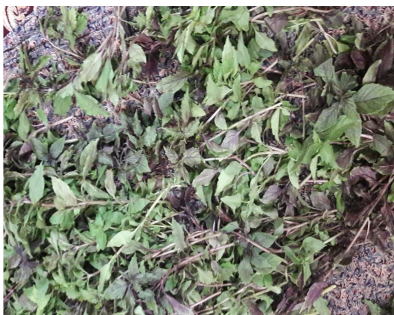
Fig 1 Purple basil.

آبی است منتقل و به مدت ۳ ساعت با سرعت یک میلی‌لیتر در دقیقه عمل اسانس‌گیری انجام گرفت. اسانس با سولفات سدیم، آبگیری و در ظرف استریل، دور از نور و در یخچال نگهداری شد [۱۲]. در شکل ۱، نمونه‌ای از گیاه نازبو بنفش نشان داده شده است.