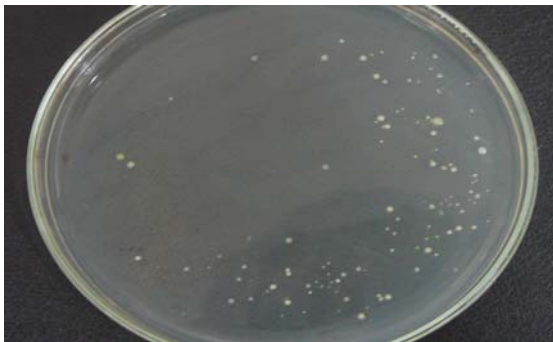
شکل ۳ رشد مخمر در پسته پوشش داده شده با فیلم بدون سوربات و عدم رشد کپک