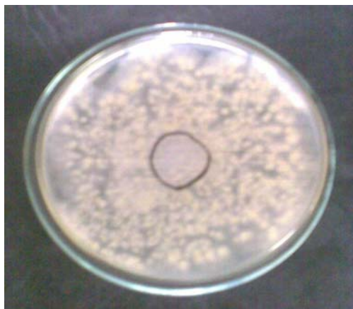
شکل ۱ تشکیل منطقه بازداری توسط فیلم حاوی ۰.۴٪ سوربات پتاسیم (الف) و عدم تشکیل آن توسط فیلم شاهد (ب) در پلیت حاوی آسپریلیوس فلاووس

جدول ۲ فعالیت ضد میکروبی فیلم‌های کربوکسی متیل سلولز حاوی سوربات پتاسیم بر روی ۳ گونه کپک آسپریلیوس*