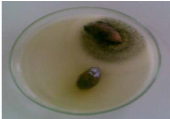
شکل ۲ رشد کپک در پسته بدون پوشش در کنار پسته پوشش دار شده با محلول فیلم حاوی ۰/۵ درصد سوربات پتاسیم

میکرومتر حاوی ۶٪ اسید سوربیک، تنها باعث کاهش تعداد سایکروتروفها در مقایسه با فیلم کنترل شد [۸].