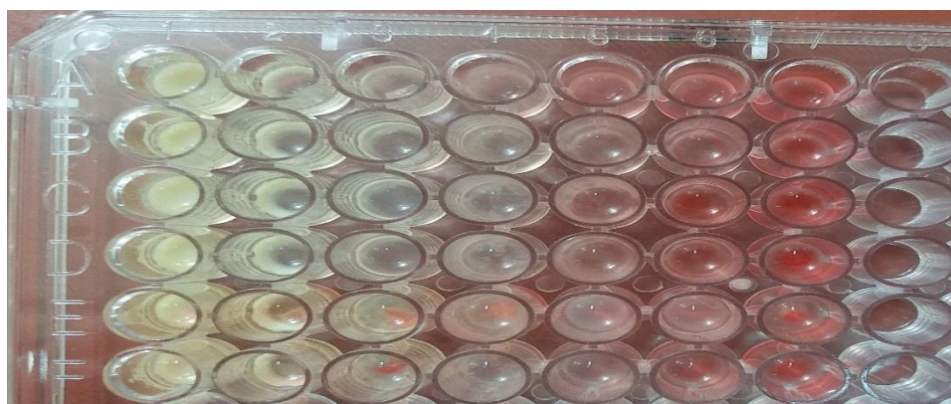
Fig 3 MIC of the Citrus aurantium essential by microdilution broth method.

65/97% لینالیل استات (0/77 تا 24/77%) و \alpha -terpineol (9/29 تا 12/12%) اجزای اصلی اسانس بهار نارنج می باشد. این محققین تفاوت میان میزان ترکیبات شناسایی شده در اسانس بهار نارنج را به تفاوت های اکولوژیکی، زمان برداشت، آب و هوا، دمای رشد و ... نسبت دادند [16]. سارو و همکاران (2013)، ترکیبات شیمیایی اسانس بهار نارنج را مورد شناسایی