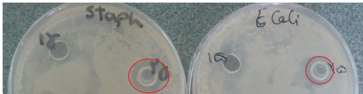
Fig 2 Inhibition zone diameters of Citrus aurantium essential oil on Escherichia coli and Staphylococcus aureus at concentration of 25 mg/ml.