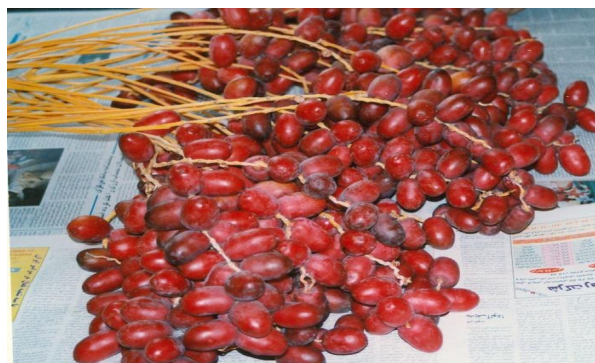
Fig 1 Mazafati date fruit at Khalal stage

نیست. همان‌طور که در شکل ۱ ملاحظه می‌شود، خلال خرما مضافی به دلیل این‌که در معرض گردوخاک بوده، وضعیت ظاهری مناسبی ندارد ولی به دلیل صافی پوست میوه در این مرحله، شستشو به‌طور مؤثری صورت خواهد پذیرفت.