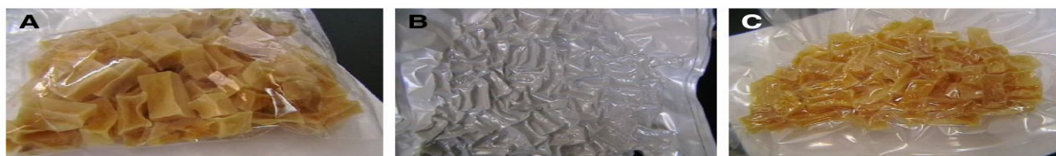
Fig 2 (A) Transpirant biaxially oriented polypropylene (BOPP) laminated; (B) polyethylene-polyamide laminate; (C) semi-transparent BOPP

بسته بندی علاوه بر ایجاد جذابیت برای مصرف کننده باعث حفاظت و جلوگیری از تخریب محصول می‌شود [۱۰]. بسته‌بندی نقش اصلی را در حفظ محصول در برابر صدمات و آسیب‌های خارجی دارد و باعث حفاظت آن در برابر اکسیژن، بخار آب، نور و افزایش ماندگاری می‌شود و علاوه بر آن خصوصیات حسی و ثابت رنگ را بهبود می‌بخشد و از خشک شدن بیش از حد ماده غذایی جلوگیری می‌کند. تخریب مواد غذایی در طول ذخیره سازی با انتخاب مناسب مواد بسته‌بندی و شرایط بسته بندی تا حد زیادی کاهش می‌یابد. فیلم‌هایی که برای بسته‌بندی انتخاب می‌شوند باید ویژگی‌های نفوذپذیری خاصی داشته باشند [۸ و ۲۶]. تعیین خواص ممانعت کنندگی پلیمرها در تعیین مدت ماندگاری محصول بسته بندی شده بسیار مهم است. بررسی رطوبت در سبزی‌های خشک شده با میکروویو کاهش رطوبت معنی داری را در نمونه‌های بسته بندی شده در BOPP شفاف و BOPP صدفی نسبت به پلی اتیلن پلی آمید نشان داد. جدول ۵ نشان می‌دهد که مکعب‌های سیب زمینی خشک شده با میکروویو که در پلی اتیلن پلی آمید بسته‌بندی شده‌اند حداقل کاهش رطوبت و نفوذ پذیری را داشته‌اند. مشابه این مشاهدات در مورد افزایش رطوبت در طول بسته‌بندی در زردآلوی خشک شده با خورشید توسط Alagoz گزارش شد [۲۷] که این نتایج می‌توانند به علت نفوذ ناپذیرتر بودن پلی اتیلن نسبت به