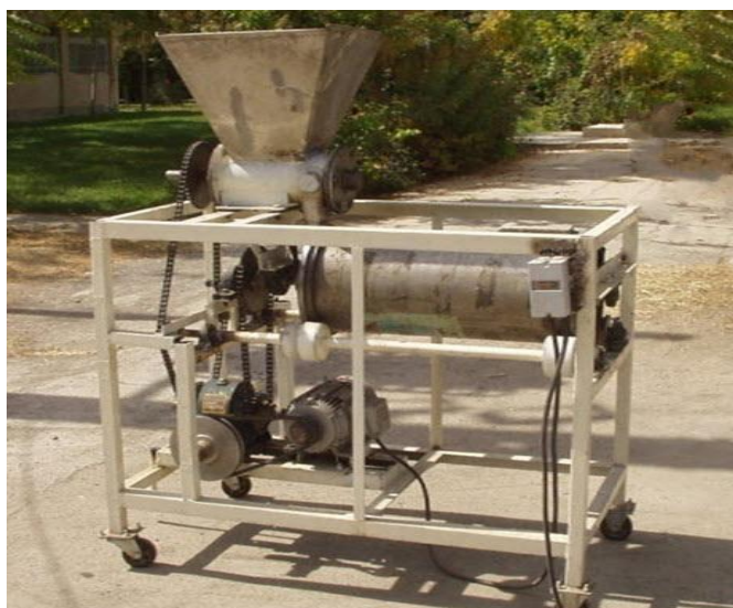
شکل ۴ دستگاه تقسیم‌کننده و چانه‌کن خمیر

جهت جلوگیری از چسبیدن خمیر به پره‌های استوانه چانه‌کن و نیز استوانه چرخان از آرد و در طرح نهایی از روغن استفاده گردید. همچنین جهت چرخش بهتر خمیر در واحد چانه‌کن، در طرح اولیه داخل لوله یا استوانه چرخان توسط جوش مضرس گردید. اما در طرح نهایی لاستیک‌های آج‌دار این عمل را به عهده گرفتند.