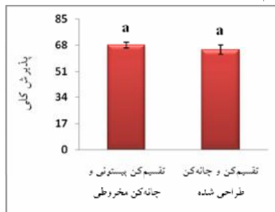
شکل ۵ تأثیر نوع تقسیم‌کن و چانه‌کن بر میزان پذیرش کلی نمونه‌های نان بربری در آزمون حسی

جویدن و بو، طعم و مزه) نمونه ۲ است که در نهایت منجر به عدم مشاهده اختلاف معنی‌دار با نمونه ۱ گردید.