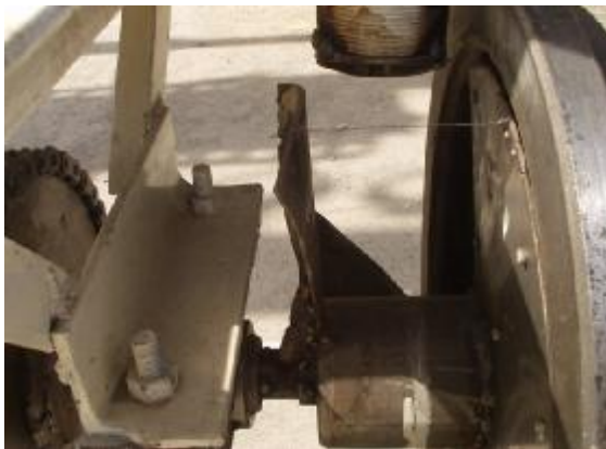
شکل ۱ شمایی از قسمت پایین دستگاه تقسیم کننده و چانه کن خمیر

به منظور برش خمیر از یک سیم نازک فولادی به عنوان سیم برش استفاده شد که سبب چسبیده شدن خمیر و افزایش ضایعات آن نمی شود. این سیستم به ابتدای ماریپچ چانه کن متصل گردید و در هر بار چرخش ماریپچ یکبار عملیات برش انجام شد (شکل ۱).